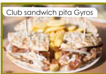
Club sandwich pita Gyros